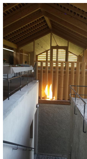
Nouvelle liaison entre la dépendance et la maison vigneronne