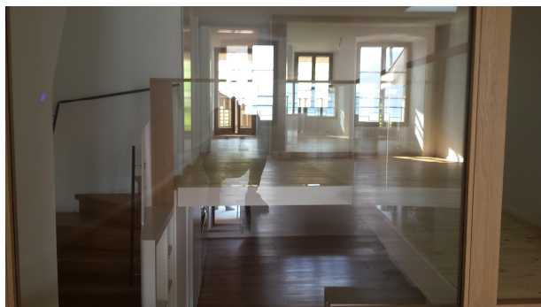
Nouveau plancher bois en planches clouées