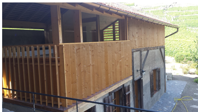
Nouvelles façade et toiture de la dépendance