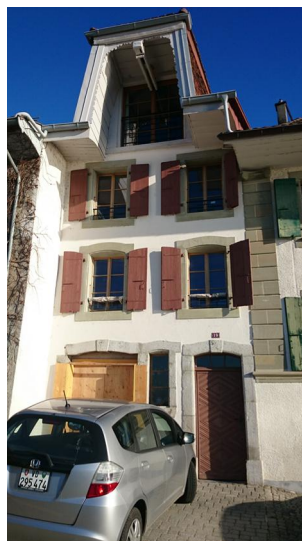
Façade sud-ouest Vue de l'extérieur

Démolition des planchers intermédiaires avec conservation de celui des combles habités pendant les travaux. Consolidation des maçonneries de pierres existantes et remplacement des tirants de la voûte de la cave. Restructuration complète de la dépendance.