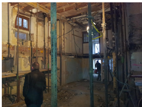
Démolition des planchers existants, étayage des combles