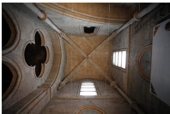
Chapelle Nord du transept