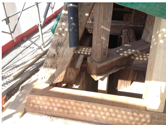
Base de la charpente trop dégradée