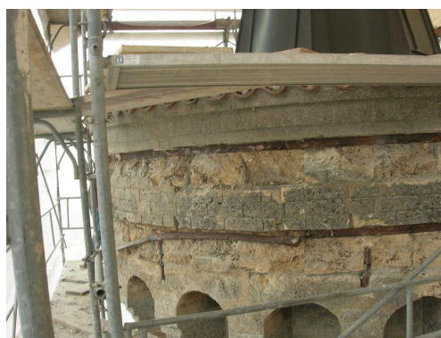
Détail cerclage du couronnement dégradé