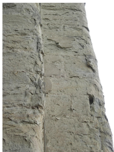
Contrefort Nord du Beffroi