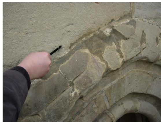
Identification des dégradations et notification dans un rapport de visite