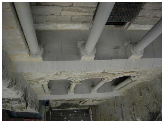
Visite des façades en nacelle