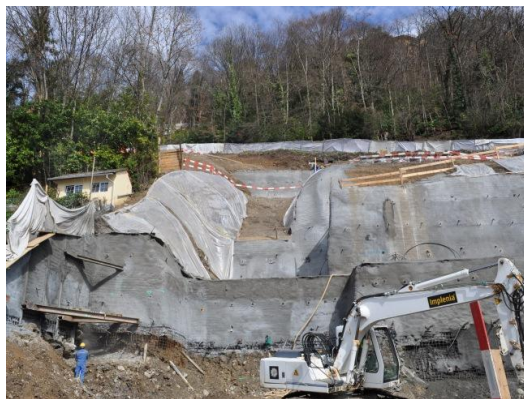
Parois clouées sur plusieurs niveaux + parois Berlinoise