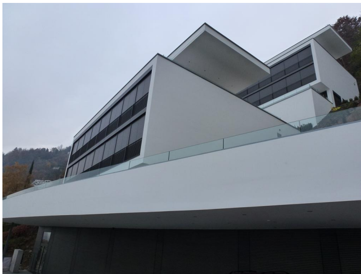
Vue des bâtiments A et B depuis les garages

Construction de trois bâtiments dans un terrain en forte pente qui a nécessité la construction de plusieurs parois clouées ainsi qu'une paroi Berlinoise. Installation de la grue avant le début des constructions, le bâtiment B a été construit autour de la grue. Bétonnage d'une cage d'ascenseur inclinée.