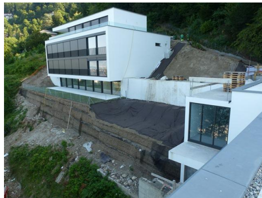
Exécution de talus en terre-armée devant le bât. C