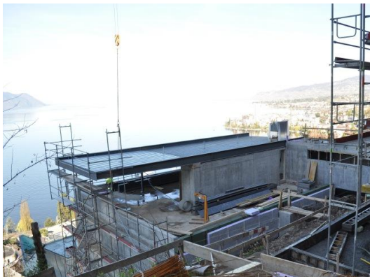
Toiture métallique en porte-à-faux