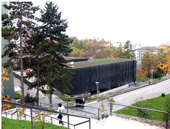
Vue depuis la route de Genève