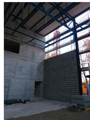
Fermeture façades en briques