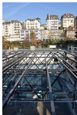
Pannes de toiture