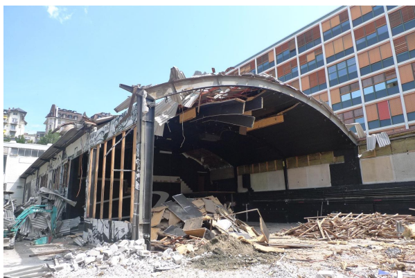
Démolition du bâtiment existant

Démolition du bâtiment central d'un complexe de trois bâtiments et reconstruction de 2 salles de théâtre en charpente métallique avec une tour de régie mitoyenne en béton armé.