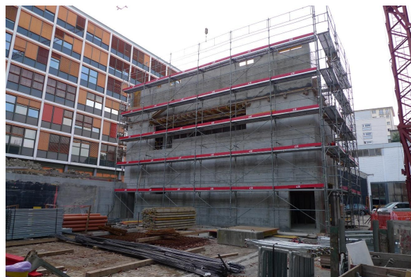
Tour régie en construction