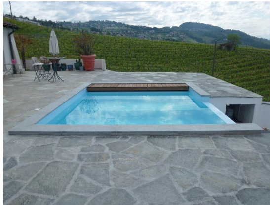
Vue du local technique et du débordement