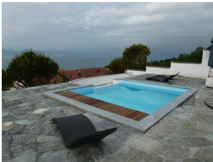
Vue depuis la terrasse, piscine terminée.

Prolongation d'une terrasse existante avec la création d'une piscine à débordement au-dessus d'un garage existant. Création d'un local technique pour la piscine.