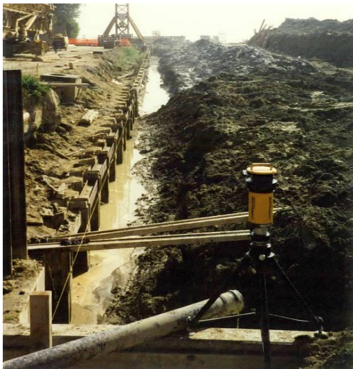
Digue Est – Rideau de palplanches

Digues en double rideau de palplanches, couronnement en béton armé et béton préfabriqué