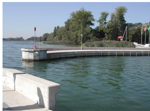
Digue Ouest – Bétonnage sur double rideau de palplanches