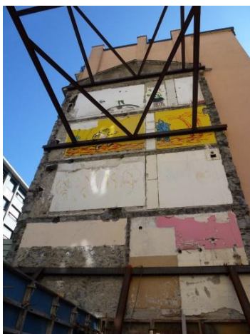
Etayage provisoire des immeubles voisins