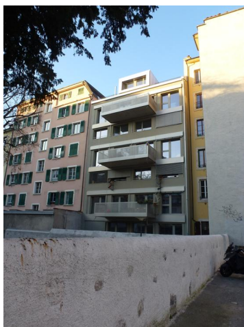
Bâtiment après travaux Façade côté cours

Le bâtiment, Minergie-P-Eco, se trouve entre deux immeubles existants et une route à fort trafic. Stabilisation des immeubles contigus pendant la démolition; reprise en sous-œuvre d'un des bâtiments existants et côté route. La toiture bois est composée de panneaux contrecollés auto-stables.