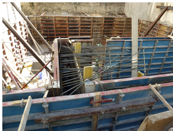
Murs du sous-sol contre les bâtiments contigus et sous-œuvre