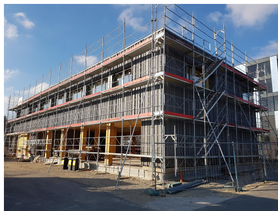
Façade Est : finition extérieure.