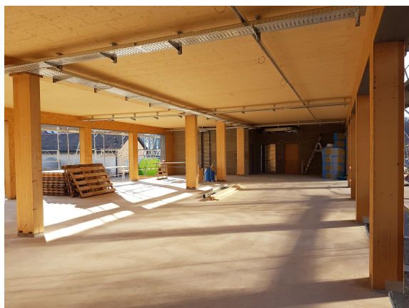
Niveau : garage véhicules

Construction d'un bâtiment de service Minergie P-ECO pour l'université de Lausanne. Le bâtiment servira de bureaux à l'étage et comme entrepôt et garage de véhicules au rez. Structure en bois préfabriquée sous forme de caisson. Le sous-sol enterré est en BA.