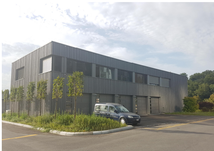
Façade Ouest du bâtiment