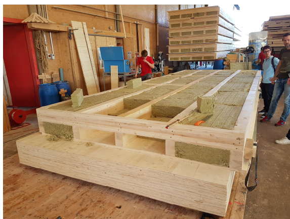
Préfabrication des éléments de toiture.