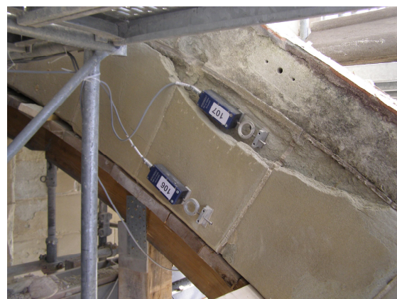
Monitoring sur arcs boutants