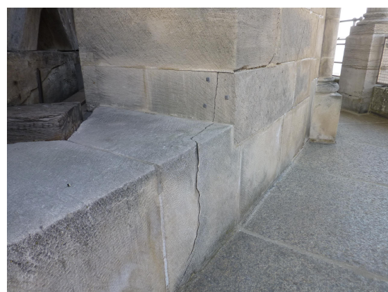
Instrumentation des fractures du beffroi