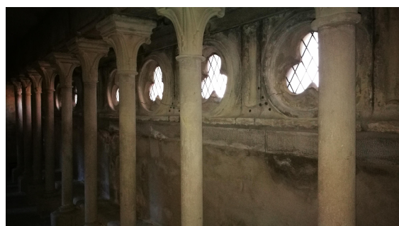
Instrumentation des fractures de la coursive sud