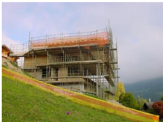
Vue générale du chalet en cours de construction

Toiture avec des avants toits, important système statique en porte à faux, terrain très en pente.