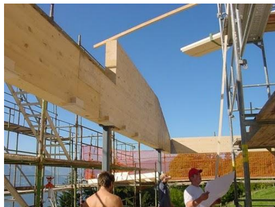
Panneau contrecollé supportant la toiture