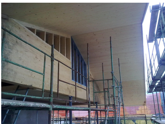
Vue de l'avant toit