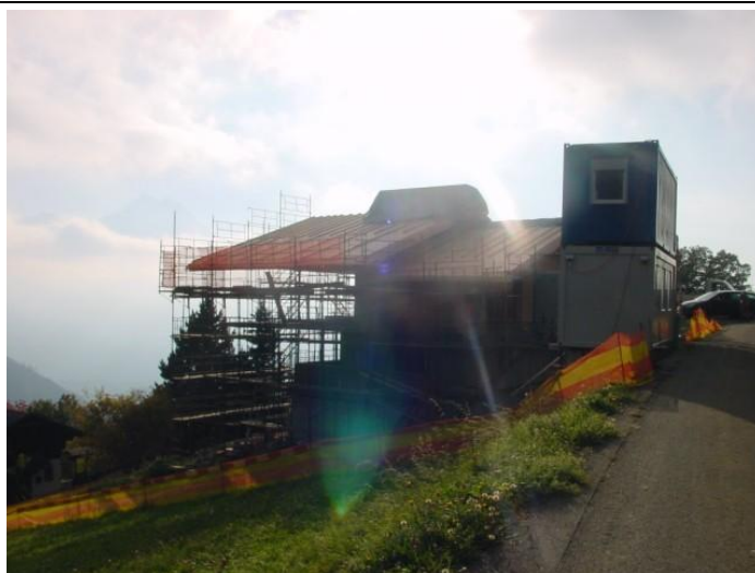
Bâtiment vu depuis la route