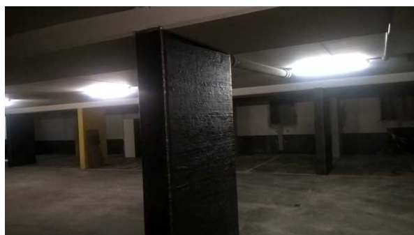
Renforcement des piliers existants par des tissus de carbone