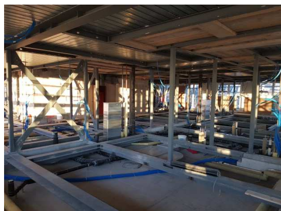
Installation des CVSE et du second-œuvre dans la structure métallique.