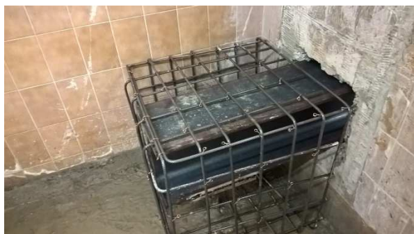
Transmission des efforts des micropieux à la structure