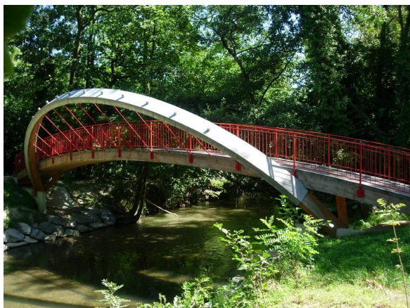
Vue de profil de la passerelle