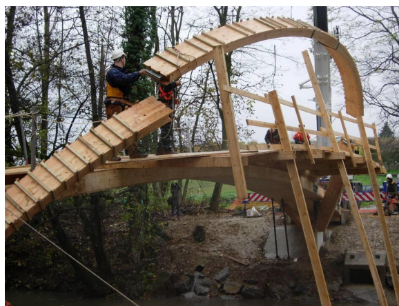
Pose de l'arc en bois