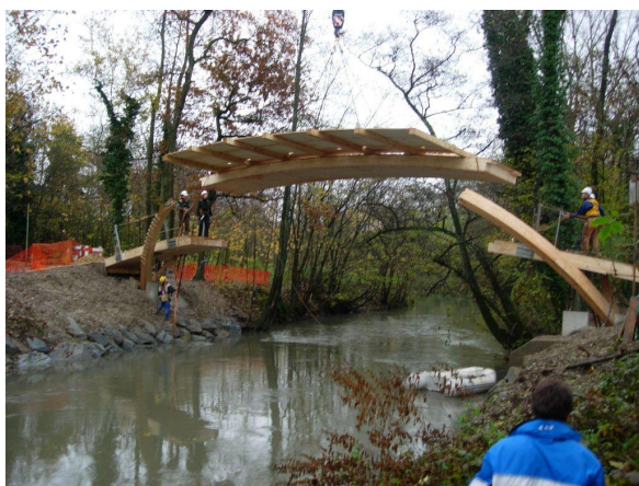
Pose du tablier bois

Création d'une passerelle en bois asymétrique, portée totale de 25 mètres. Tablier voûté et cintré.