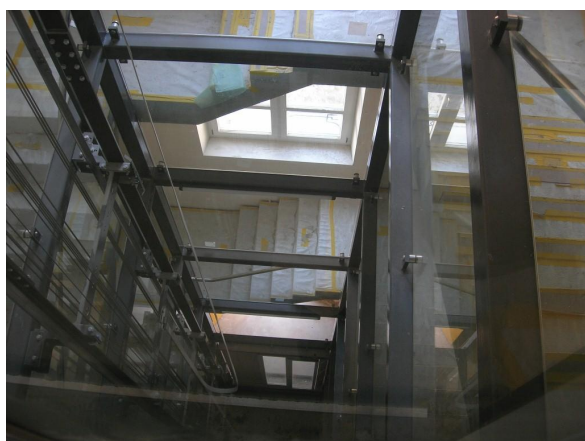
Création d'une cage d'escaliers avec ascenseur