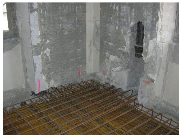
Ferrailage d'une nouvelle dalle