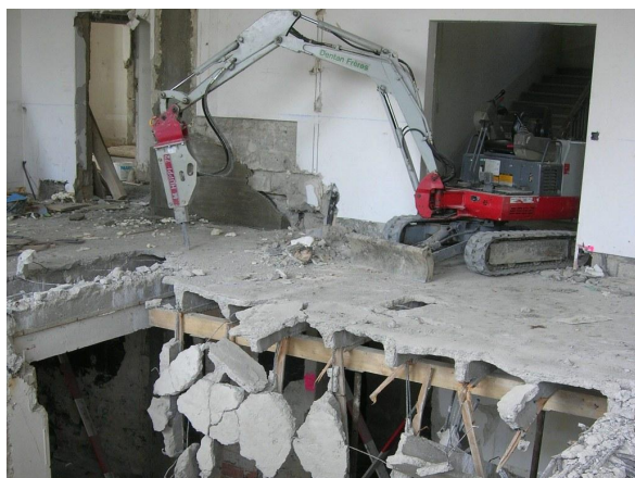
Démolition des dalles nervurées

Démolition des dalles nervurées par étapes et remplacement par dalles en béton armé. Renforcement global de la structure des façades porteuses. Création d'une cage d'escaliers avec ascenseur.