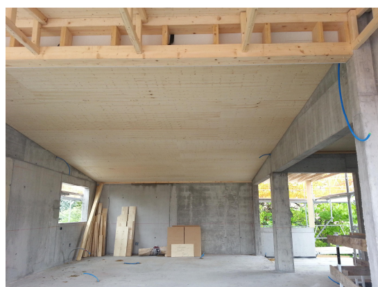
Toiture composée de caissons en bois préfabriqués avec isolation incorporée.