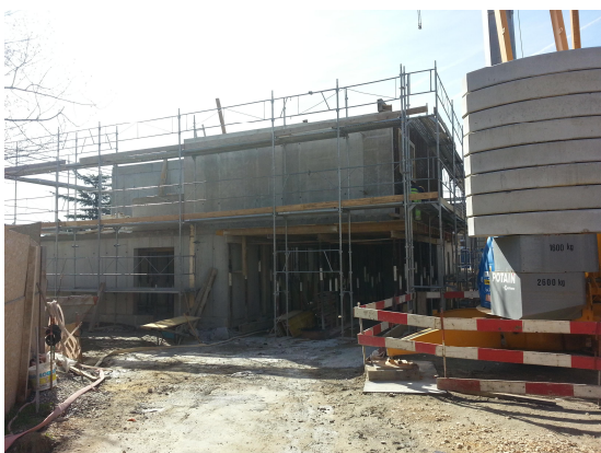
Vue du porte-à-faux de 5,0[m] de portée dans l'angle nord-ouest de la villa.