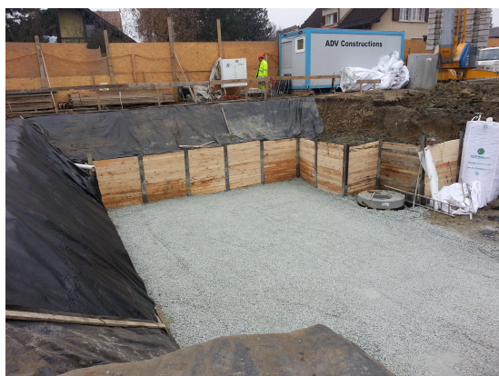
Terrassement avec paroi micro-berlinoise et Misapor en fonds de fouille.