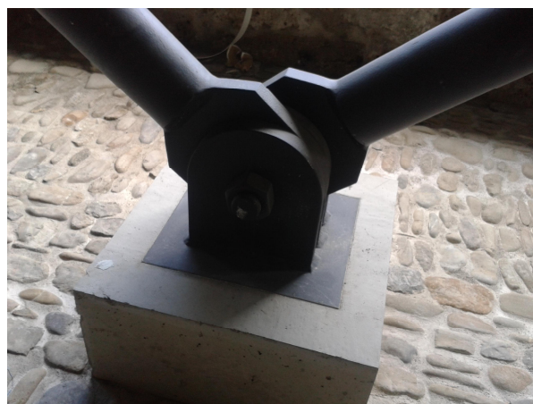
Détail de l'assemblage des bielles inclinées faisant office de piliers pour le 1 er étage.