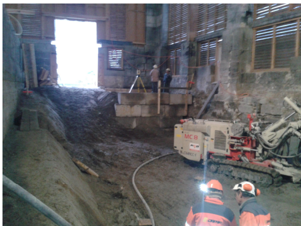
Reprises en sous-œuvre des fondations des murs historiques (façades extérieures et mur porteur intérieur), création d'un sous-sol