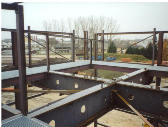
Assemblage des poutres principales