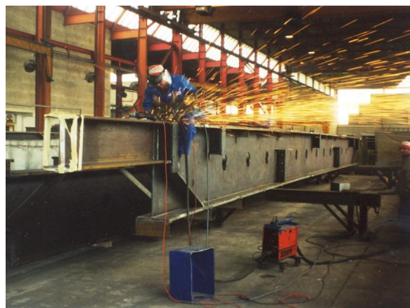
Fabrication des poutres principales en atelier