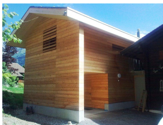
Vue arrière du garage