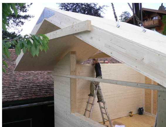
Montage de la toiture