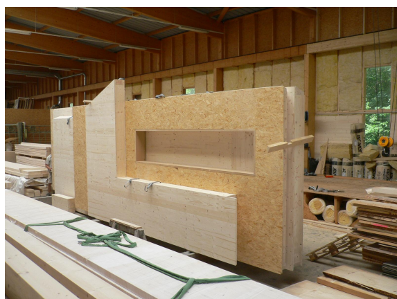
Préfabrication des caissons / parois / de la toiture