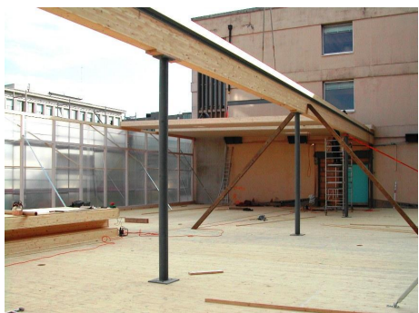
Montage de la toiture