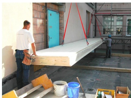
Pose d'un élément de plancher